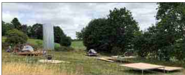
Aire de bivouac de Millevaches

Dîner et nuit à l'aire de bivouac de Millevaches (tentes fournies).