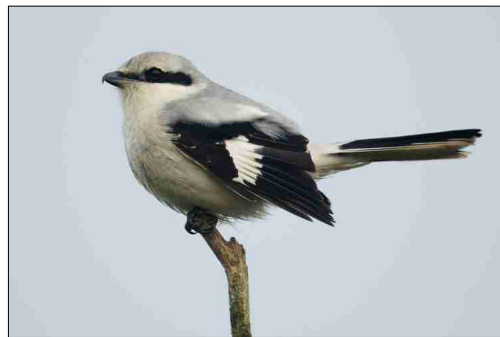
Pie Grièche Grise