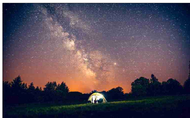
Aire de bivouac de Millevaches