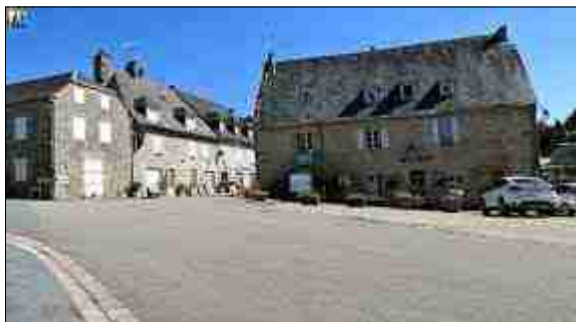
Bourg de Tarnac

Dîner et nuit à l'hôtel de voyageurs ou un autre hébergement à Tarnac.