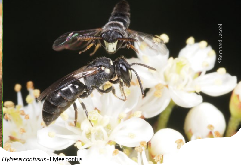
Hylaeus confusus - Hylée confus