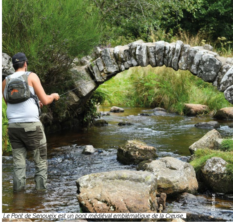
Le Pont de Senoueix est un pont médiéval emblématique de la Creuse.