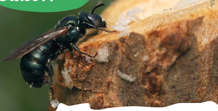
Ceratina chalybea - Cératine d'acier