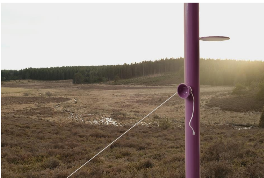
© PEAKS + Simon BOUDVIN, 2018