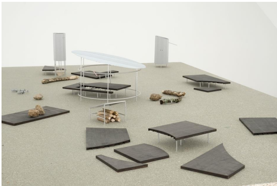
© PEAKS + Simon BOUDVIN, 2018

La proposition de PEAKS + Simon BOUDVIN s'appuie sur un système d'objets minimalistes pouvant être dispersés selon les situations. Ces objets font signe, ils répondent à leur fonction et jouent avec l'intelligence du randonneur pour s'ouvrir à d'autres usages (support d'un toit, porte-manteau, etc.). Le modèle proposé s'intègre parfaitement dans le paysage.