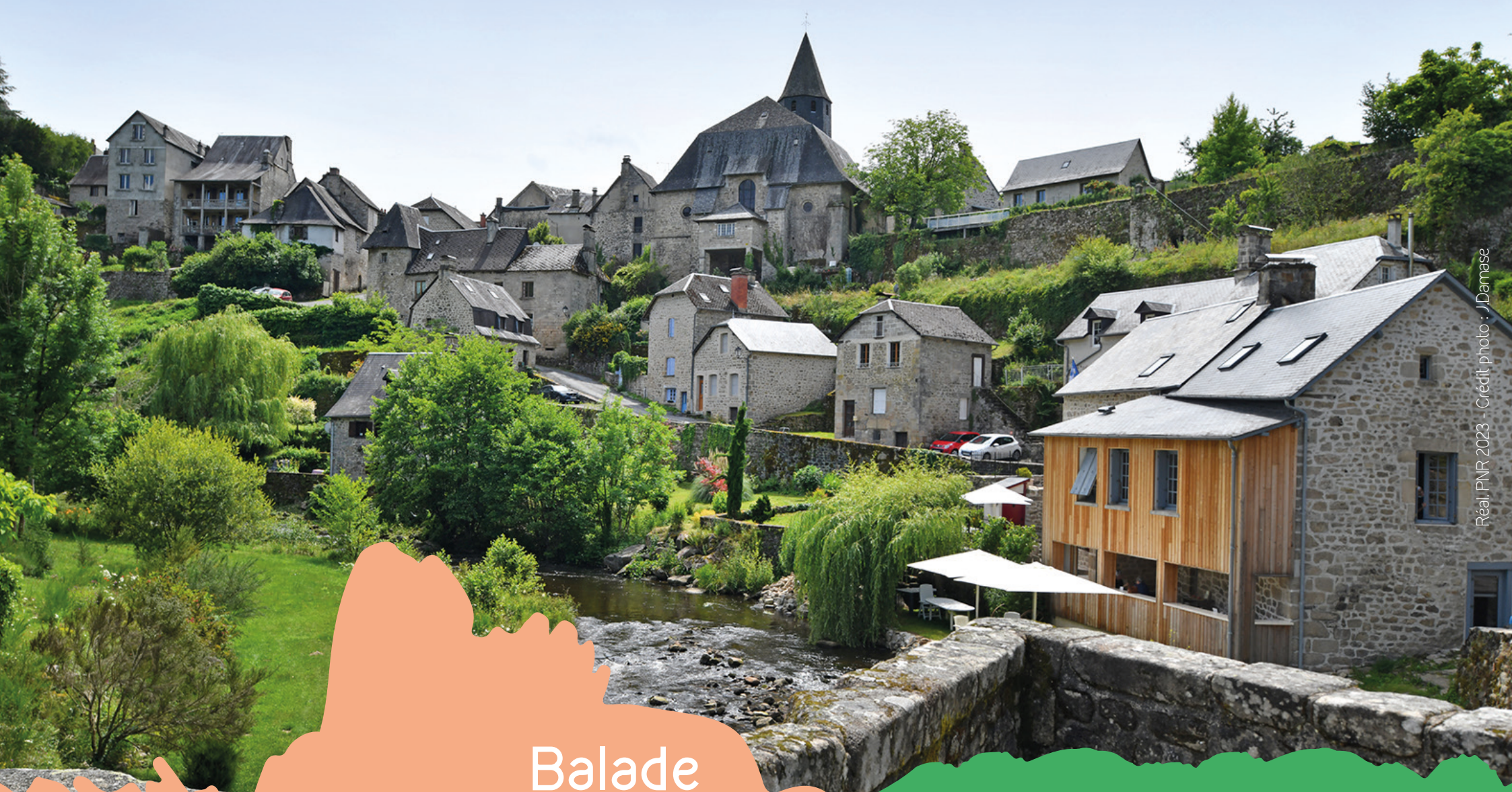
Réal: PNR 2023